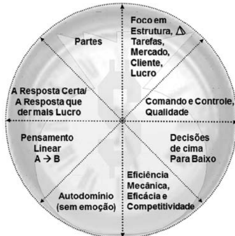
Figura 1. Visão mecanicista-mercadológica de mundo

Elaborada a partir de ideias apresentadas por Silva, Peláez, Romero (2001) 11 e de Ellinor, Gerard (1998) 34 .