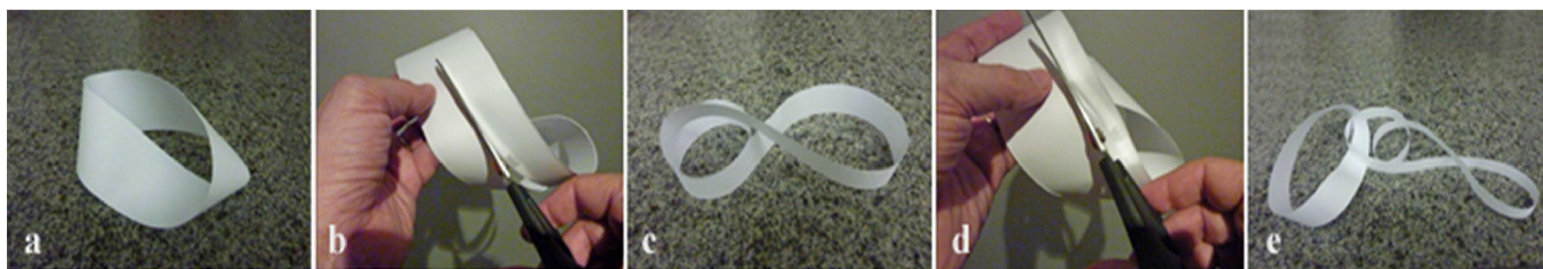
Figura 1. Cinta de Möebius

Pegando-se uma tira de papel, colando-se as suas extremidades, depois de dar-lhe uma torção de 180°, teremos uma cinta de Möebius (Figura 1a). Uma cinta comum (sem torção) é um objeto que tem dois lados: o lado de dentro e o lado de fora, e tem duas bordas: a borda direita e a borda esquerda. Já a cinta de Möebius é um objeto que tem somente um lado e somente uma borda, o lado de fora é o mesmo lado de dentro e a borda da direita é a mesma borda da esquerda.